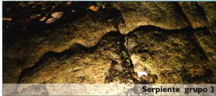
Serpiente grupo 3

Sobresalen en esta manada tres figuras de considerables dimensiones en las que sus voluminosos cuerpos se han obtenido rebajando la superficie de la roca. Presentan como características más relevantes, un cuello alargado y pares de extremidades muy finas dispuestas en arco, un recurso destinado sin duda a simular el galope y a ganar en dinamismo.