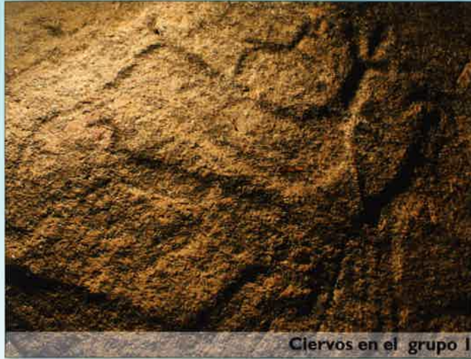
Ciervos en el grupo I

Pero los grabados que despiertan mayor interés son los del grupo I. Observamos una manada de cérvidos marchando al galope en dirección Este. La escena encajaría en la realidad natural: un macho dominante con varias hembras y unas crías transitando por una ladera.