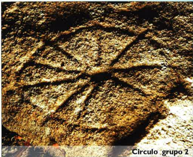
Circulo grupo 2

El conjunto lo componen hasta la fecha cinco grupos de grabados en los que se identifican diferentes figuras: circulares y rectangulares en el grupo 2; serpentiforme y escenas de monta en el grupo 3; cazoletas de diferentes tamaños en el grupo 4, y serpentiforme en el grupo 5.